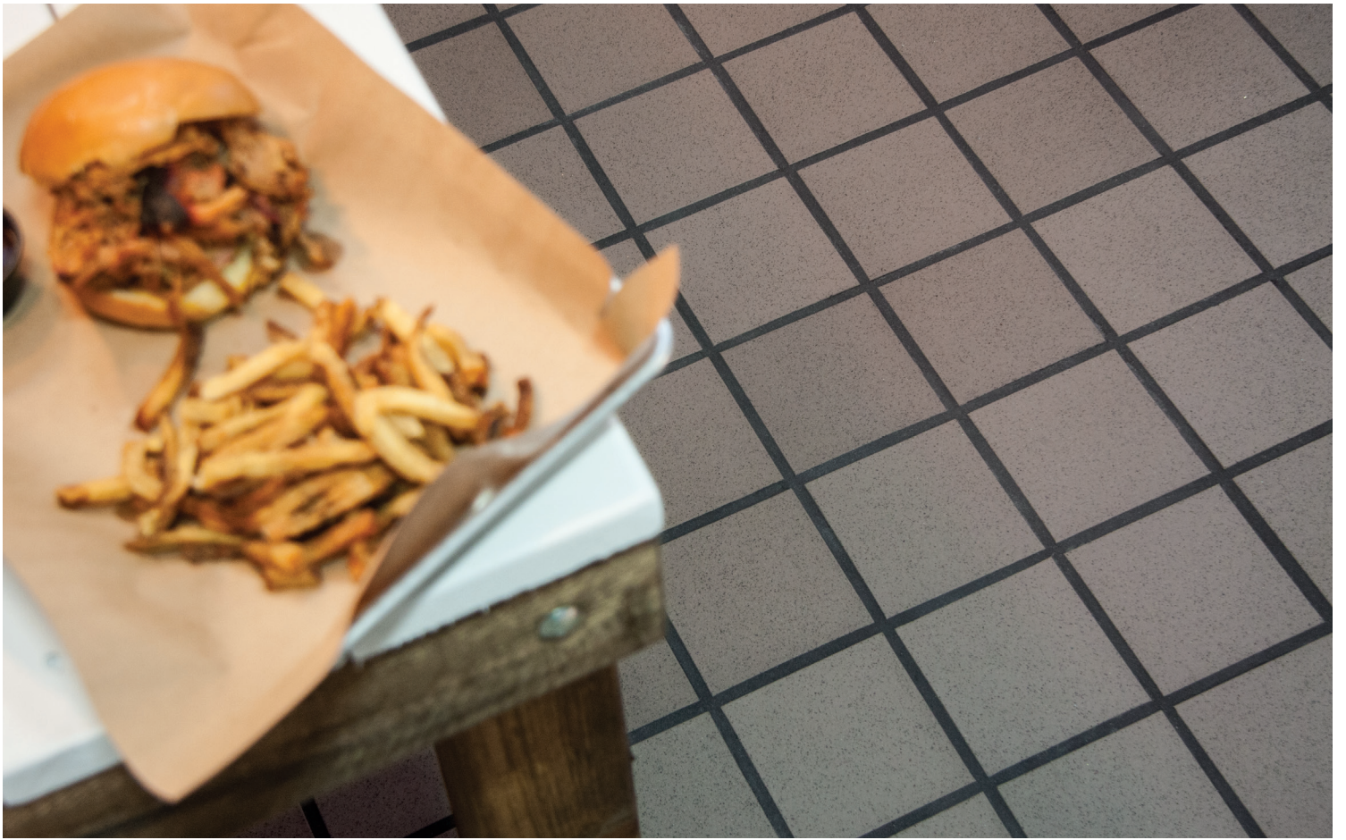
PURITAN (Gris) - abrasif