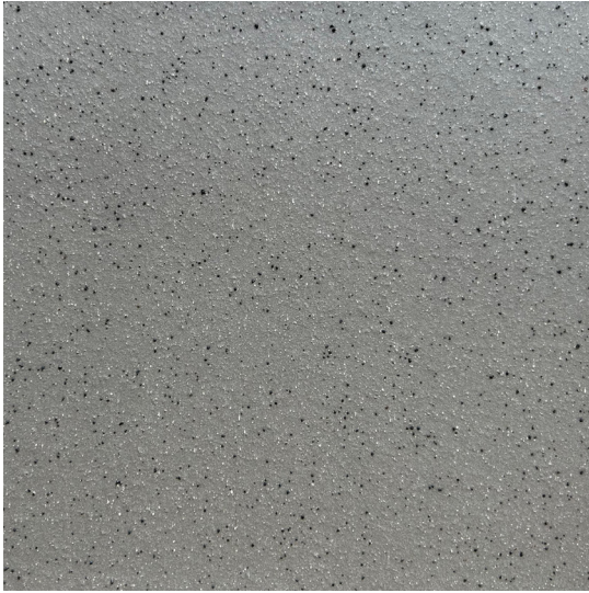
15 x 15 cm (6 x 6) MT.PTN.GRY.IRON.6x6