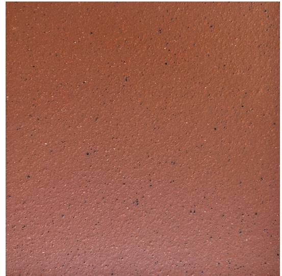
15 x 15 cm (6 x 6) MT.MAY.RED.IRON.6x6

Trims are also stocked for Metropolitan Series. Please ask your Sales Representative for further detailed information.